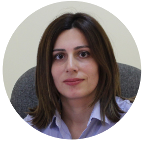
Անահիտ Ավանեսյան ՀՀ առողջապահության նախարարի պաշտոնակատար