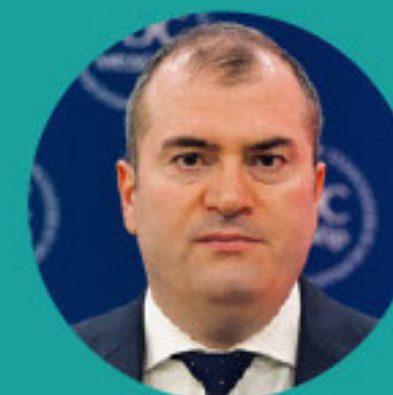
ZALIM BALKIZOV, MD, PHD MHPE, FAMEE / RUSSIA ԶԱԼԻՄ ԲԱԼԿԻԶՈՎ / ՈՐՈՍՏԱՆ

Հղում դեպի «Journal of European CME»-ի հոդվածը