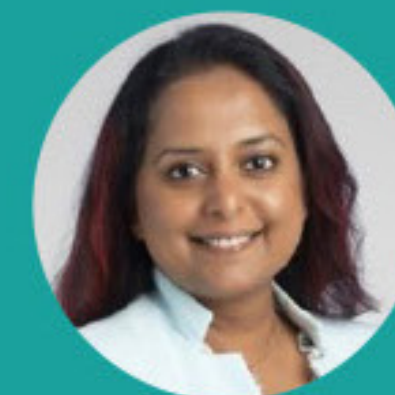
ROSHNI SREEDHARAN, MD FASA FCCM / USA ՈՂՆԻ ՍՐԻԴԱՐԱՆ / ՄՄՆ