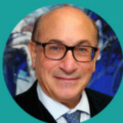
ARA TEKIAN, PHD, MHPE UNIVERSITY OF ILLINOIS COLLEGE OF MEDICINE / USA ԱՐԱ ԹԵԹՅԱՆ / ՄՄՆ